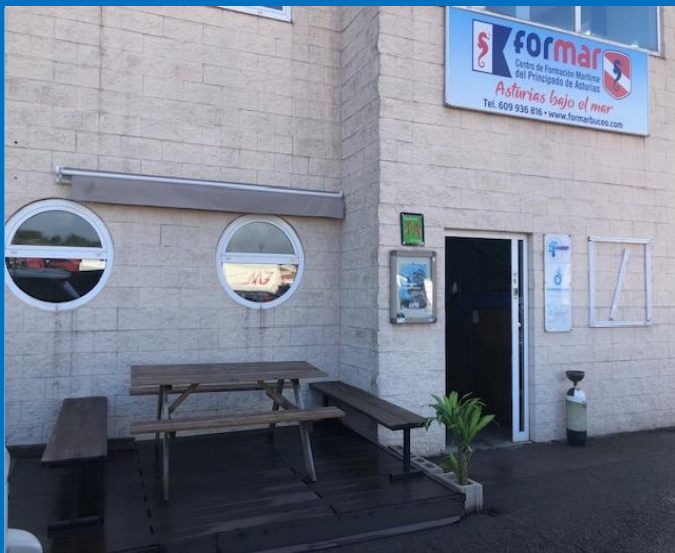
Zona descanso exterior